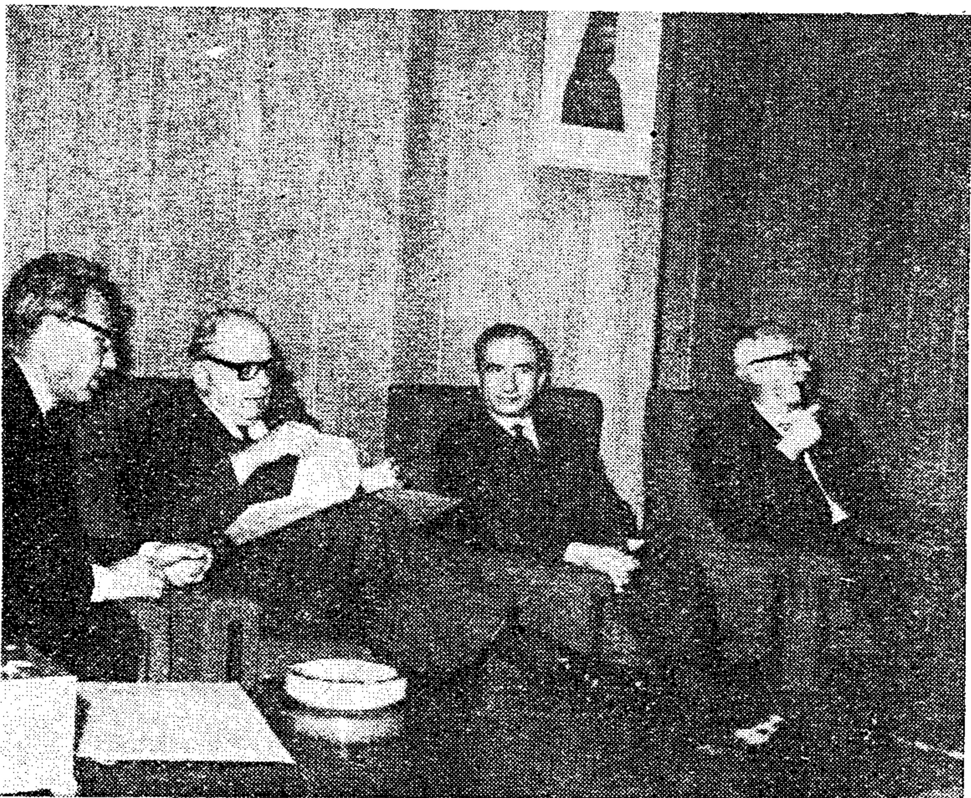
Ο κ. Μπόέρμα, δεύτερος έξ άριστερῶν, συνομιλῶν μετά του 'Υπουργοῦ Γεωργίας κ. Τομπάζου και του Γεν. Διευθυντοῦ του 'Υπουργείου Γεωργίας κ. Μιχαηλίδη.

Εἴμεθα βέβαιοι ότι με τήν τεραστίαν πείραν εις διεθνή γεωργικά ζητήματα που διαθέτει ο κ. Α. Μπόέρμα, θά συνεχισθῆ έπιτυχέστερον τὸ πολύτιμον έργον τής 'Οργανώσεως Τροφίμων και Γεωργίας.